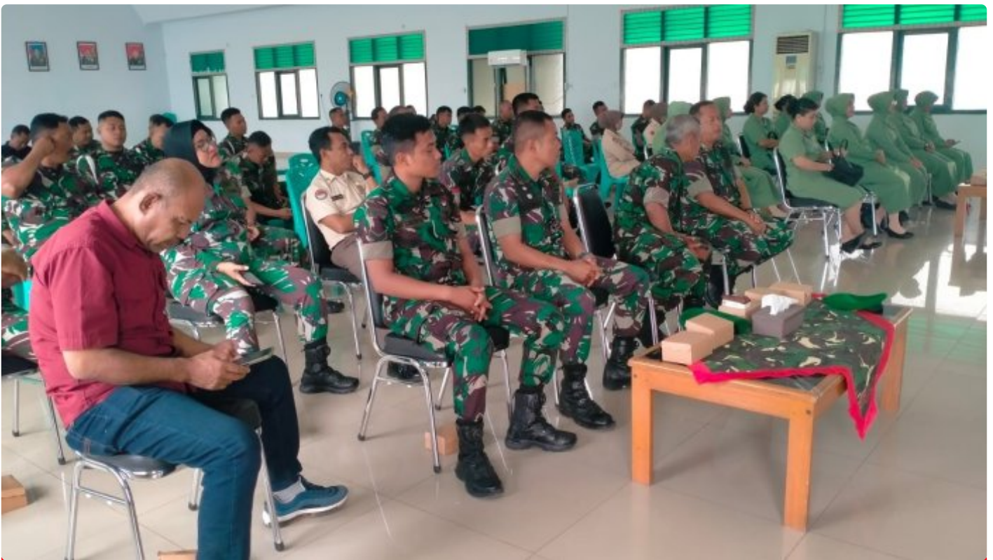
Personil Korem 132/Tdl ikuti pelaksanaan pembinaan netralitas TNI di Pemilu 2024

PALU, Sulawesi Tengah- Dalam menjaga esensi Demokrasi, Korem 132/Tdl menerapkan Netralitas TNI dengan penuh tanggung jawab dengan melaksanakan Pembinaan Netralitas TNI pada Pemilu dan Pilkada Th 2024 kepada Prajurit, PNS dan Persit bertempat di Aula Manggala Sakti Makorem 132/Tdl Jl. Jenderal Sudirman N0.25.Palu, Rabu (07/02/2024).